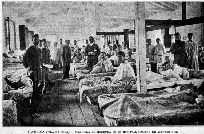
HABANA (ISLA DE CUBA).—UNA SALA DE MEDICINA EN EL HOSPITAL MILITAR DE ALFONSO XIII.

No hay tratamiento curativo para la fiebre amarilla. El tratamiento es sintomático y consiste en paliar los síntomas y mantener el bienestar del paciente. Uno de sus principales características es que altera la coagulación de la sangre produciendo hemorragias internas, que entre otros signos ocasiona vómitos que acostumbran a tener un color rojo oscuro ennegrecido al coagularse, de ahí su nombre de vómito negro. 60